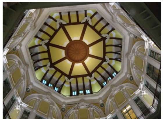
【東京駅のドーム天井】

東京駅南ドームレリーフです。昨年の10月に復元された天井です。一見の価値あり！！